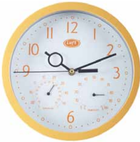
▲ RPW040A AMARILLO