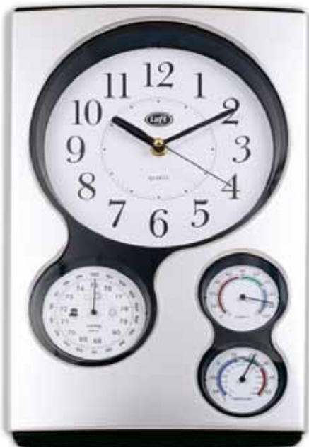
◀ 390RW GRIS