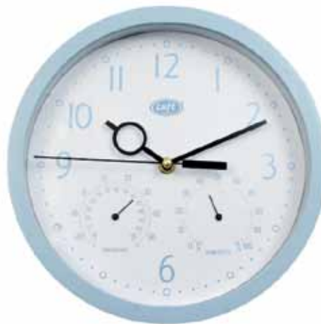
▲ RPW040C CELESTE